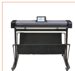
Platzierung auf eigenem, optionalem Standfuß