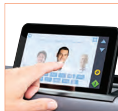
Durchsuchen Sie auf SD One MF Benutzerprofile und scannen Sie direkt an Speicherorte, die für jeden einzelnen Benutzer voreingestellt sind.