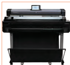
Optionales höhenverstellbares Untergestell zur Platzierung auf dem Drucker.