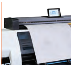
SD One MF ist leicht genug, um auf jeder ebenen Fläche oder einem optionalen, höhenverstellbaren Untergestell platziert zu werden.

SD One MF verfügt über eine integrierte Software zur Druckerverwaltung, über die Sie die Kosten jedes Scans, jeder Kopie oder jedes Ausdrucks nachverfolgen können – perfekt für die Abrechnung nach Arbeitsgruppe oder Kunden.